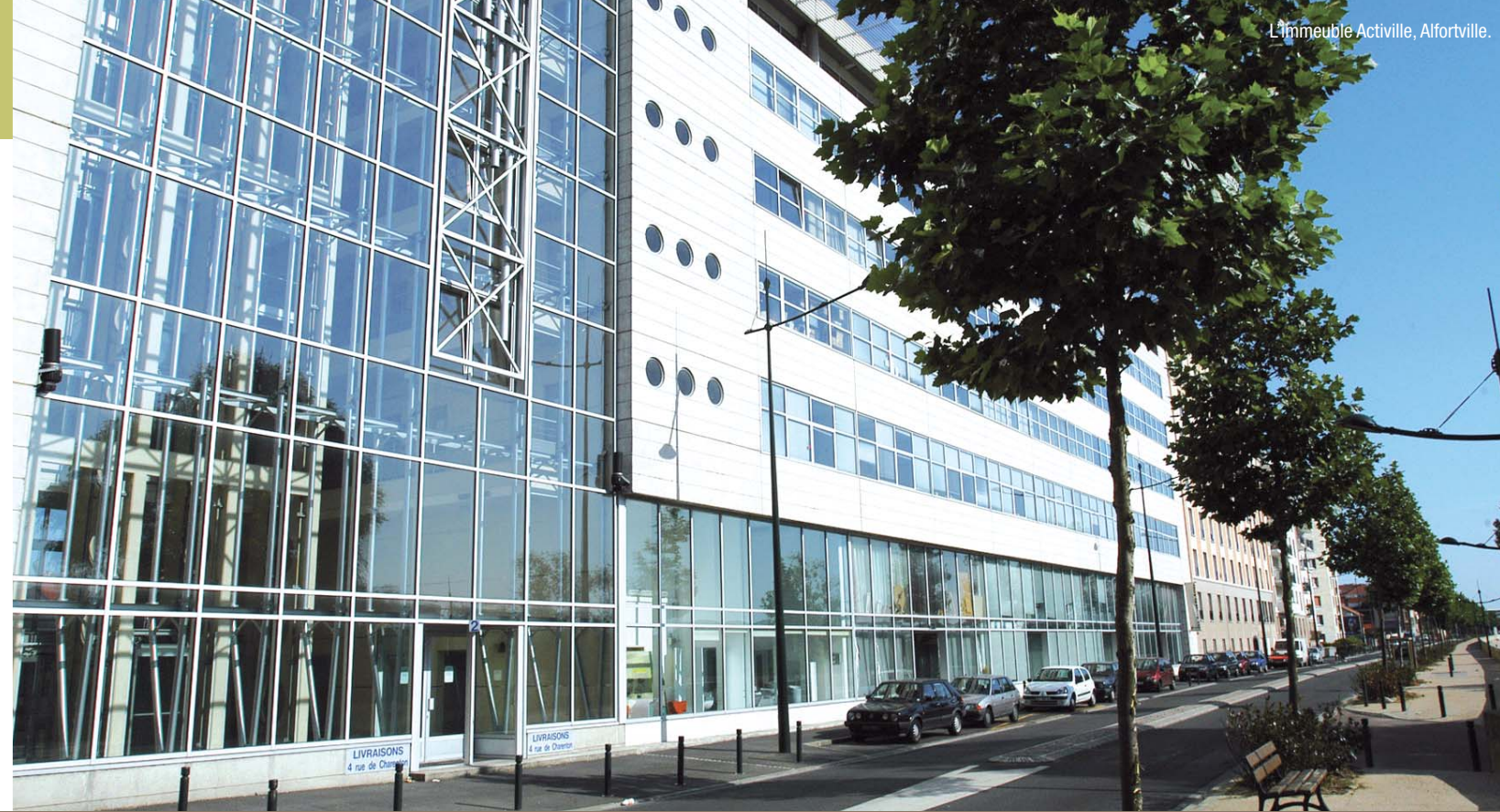
L'Immeuble Activille, Alfortville.

Alfortville, Créteil et Limeil-Brevannes