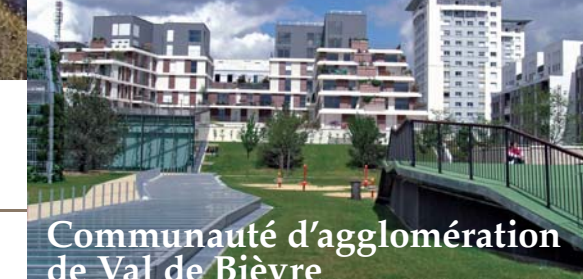
Les Portes d'Arcueil, quartier de la Vache Noire, Arcueil.